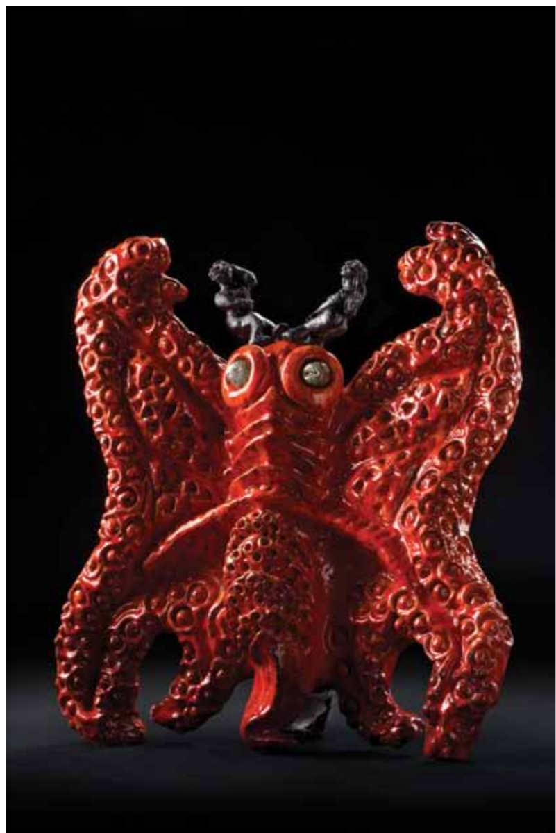
Mariposa · Terracota esmaltada · 55 x 46 x 15 cm · 2009