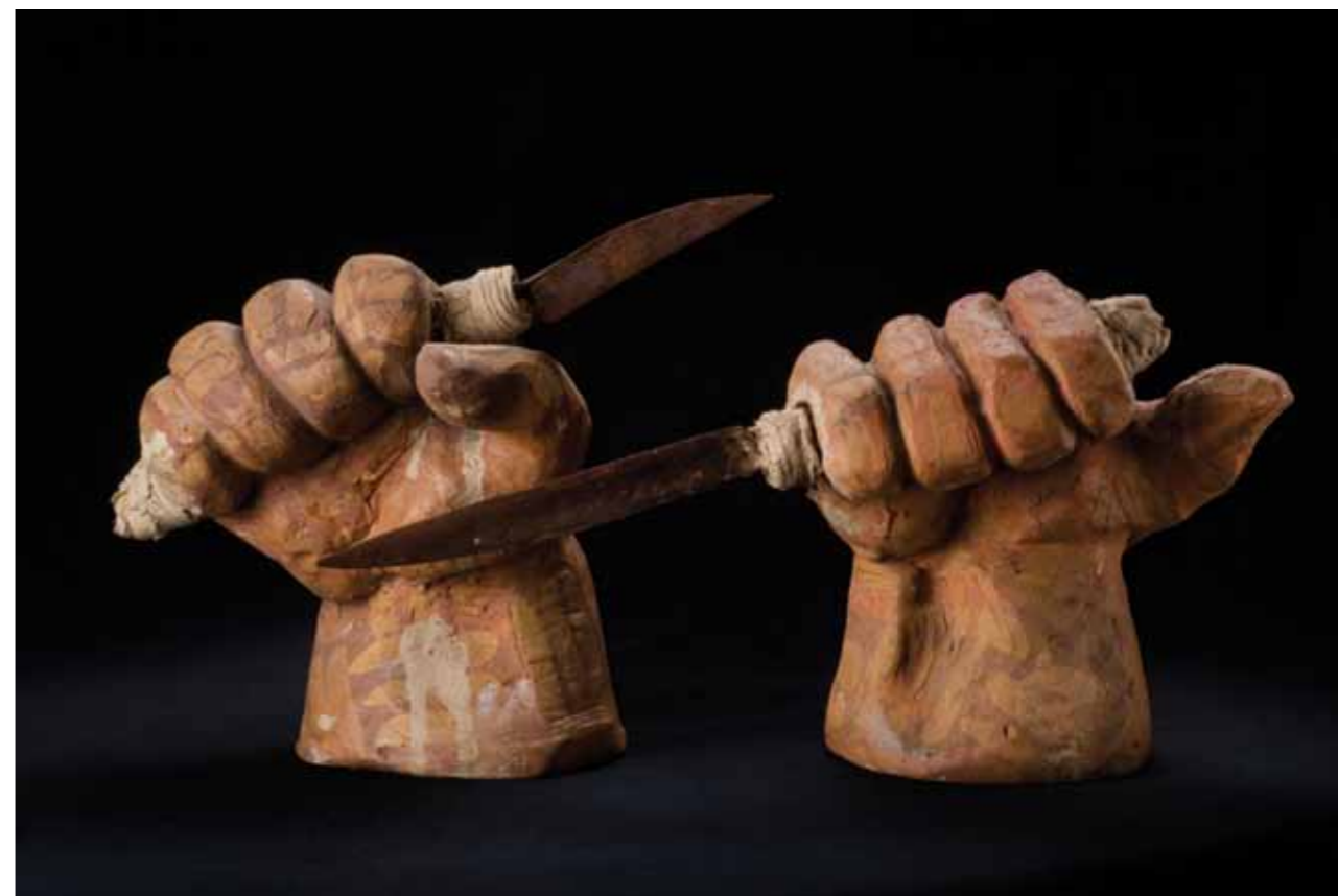
Martirio de San Váscos (fragmento) · Terracota engobada y cuchillos · Medida variable · 1994