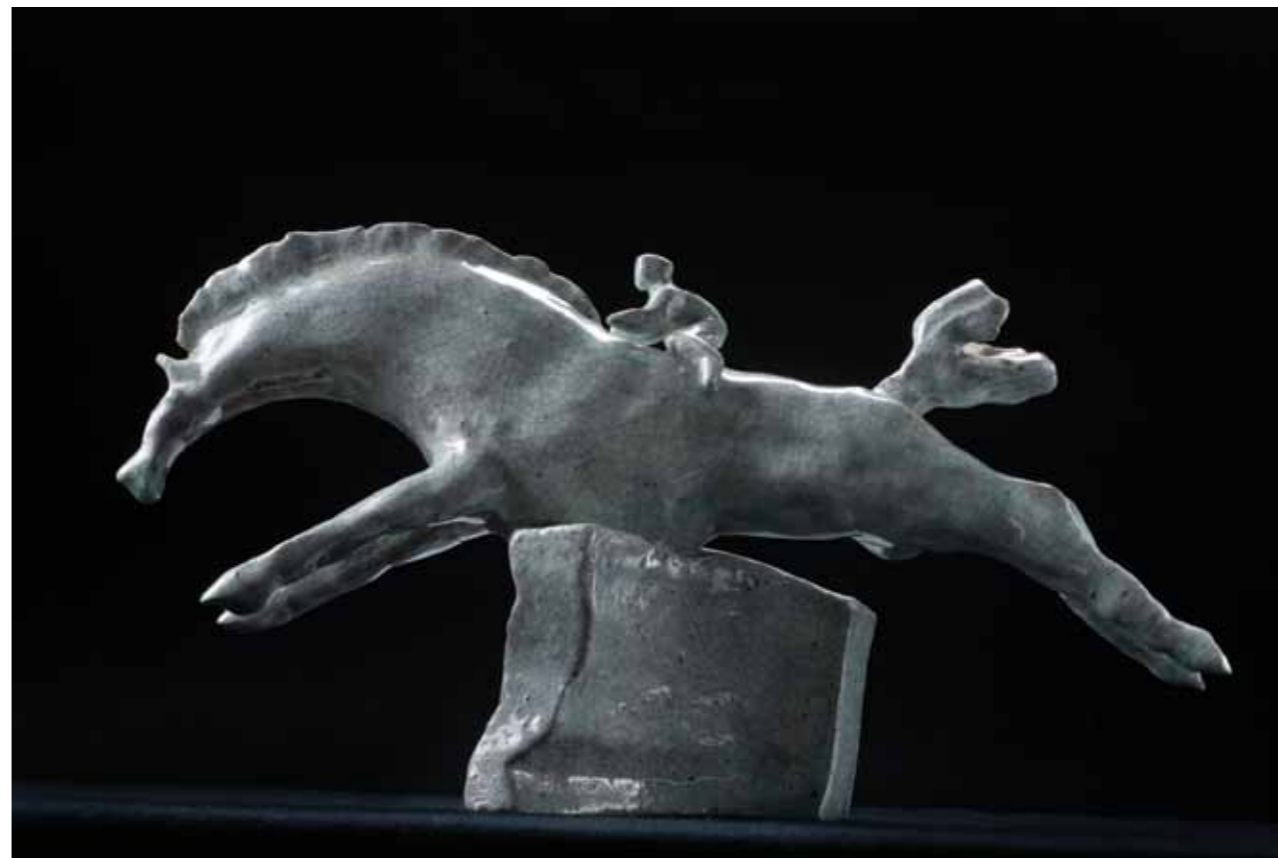
Papá · Terracota esmaltada · 24 x 35 x 20 cm · 2001