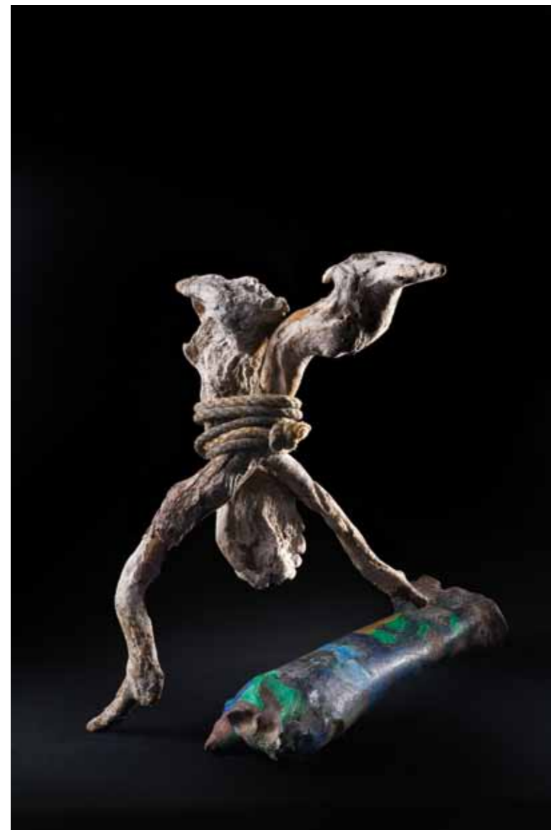
Personaje Natural · Técnica mixta · 50 x 20 x 30 cm · 2009