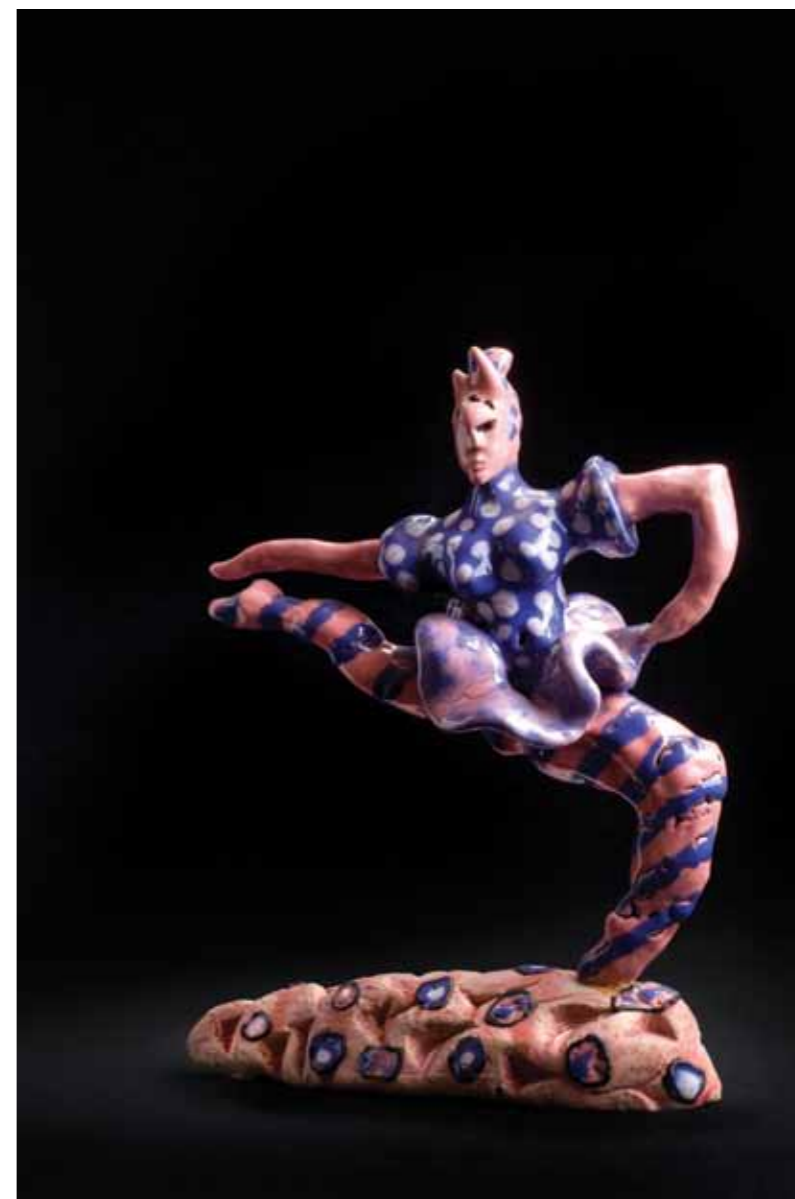
Bailarina · Terracota esmaltada · 25 x 22 x 8 cm · 2007