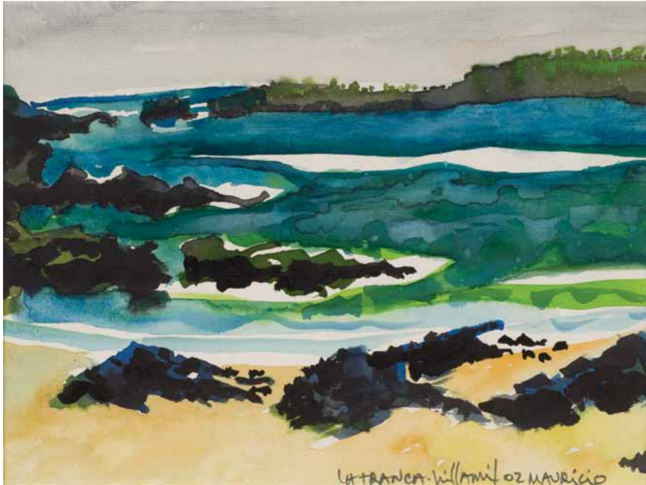
La Tranca de Puerto Villamil · Acuarela · 25 x 32 cm · 2002