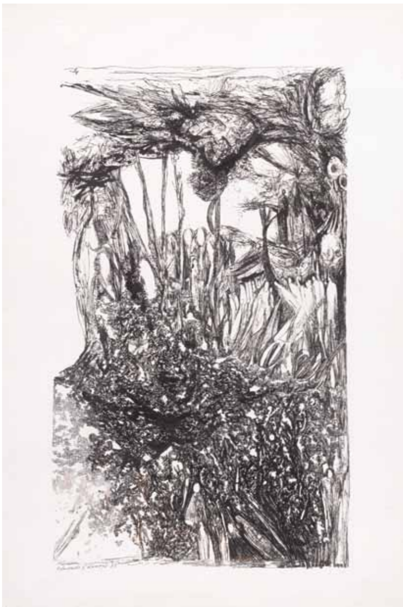
Desgarre · Plumilla · 70 x 55 cm · 2008