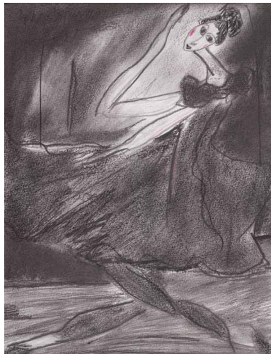
Serie: Mujeres Vogue · Lápiz sobre papel · 35 x 25 cm · 2009