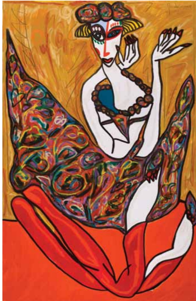
Serie: Bailadoras Marionetas Óleo sobre tela · 110 x 170 cm · 2009