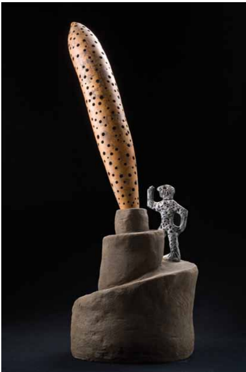
Asención al Churo de La Alameda Cerámica esmaltada y calabazín · 70 x 28 x 28 cm · 2009