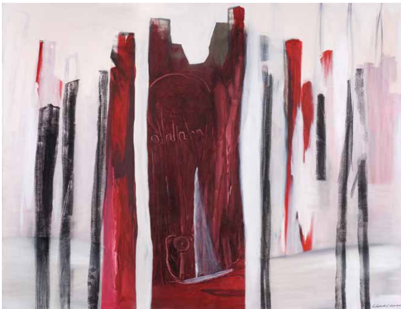
S/T · Óleo sobre tela · 100 x 150 cm · 2008