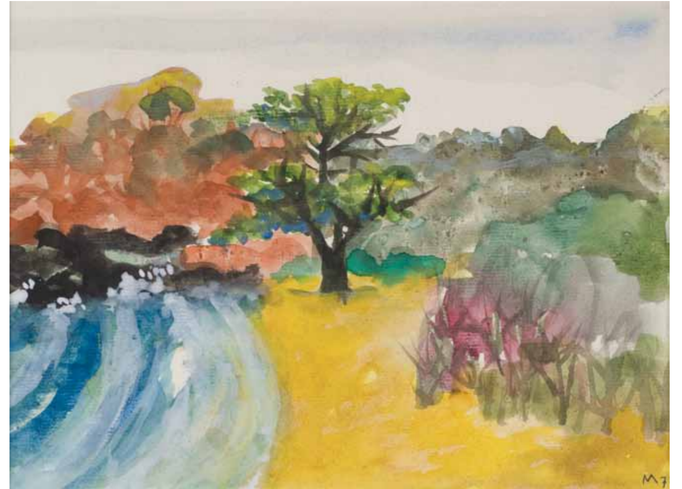
Playa Barahona. Isabela · Acuarela · 25 x 32 cm · 2007