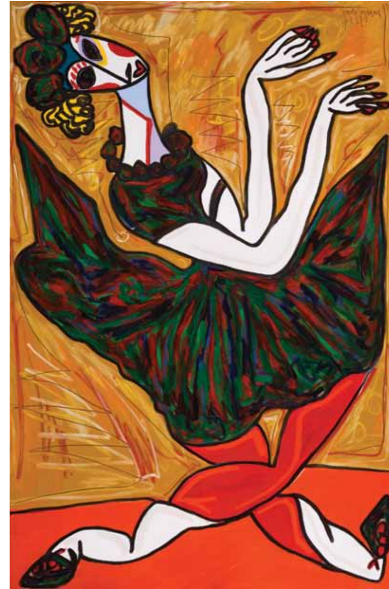
Serie: Bailadoras Marionetas · Óleo sobre tela · 110 x 170 cm · 2009