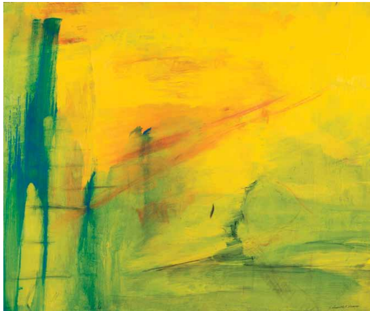
S/T · Óleo sobre tela · 100 x 105 cm · 2008