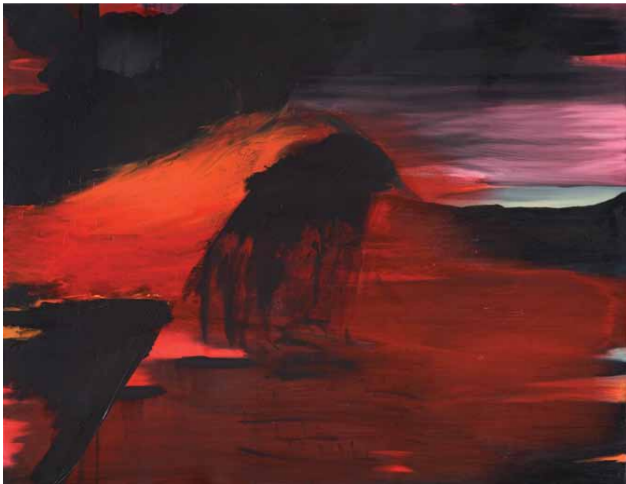
Quilotoa · Óleo sobre tela · 100 x 105 cm · 2008