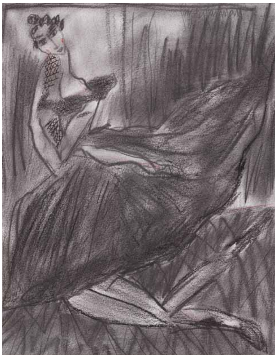
Serie: Mujeres Vogue · Lápiz sobre papel · 35 x 25 cm · 2009