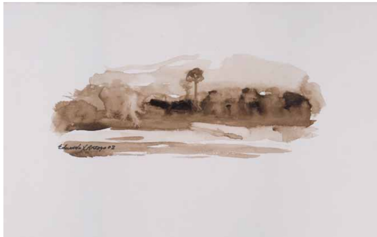
S/T · Acuarela sobre algodón · 17 x 35 cm · 2008

En soledad estuve cerca de tu soledad, Eduardo. Soy demasiado vieja y tú eres un gran artista. Es doloroso ver como el hombre sea ciego frente a lo bello. A lo menos, esta retrospectiva te ha dado reconocimiento. "Cuando hace sesenta años vi una exposición de Camilo Egas, sentí esta misma emoción"