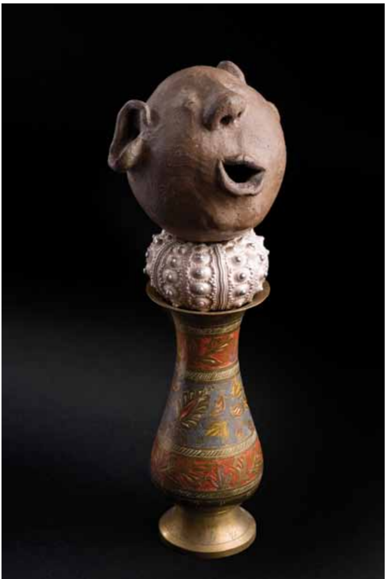
Personaje Natural · Técnica mixta · 50 x 20 x 30 cm · 2009