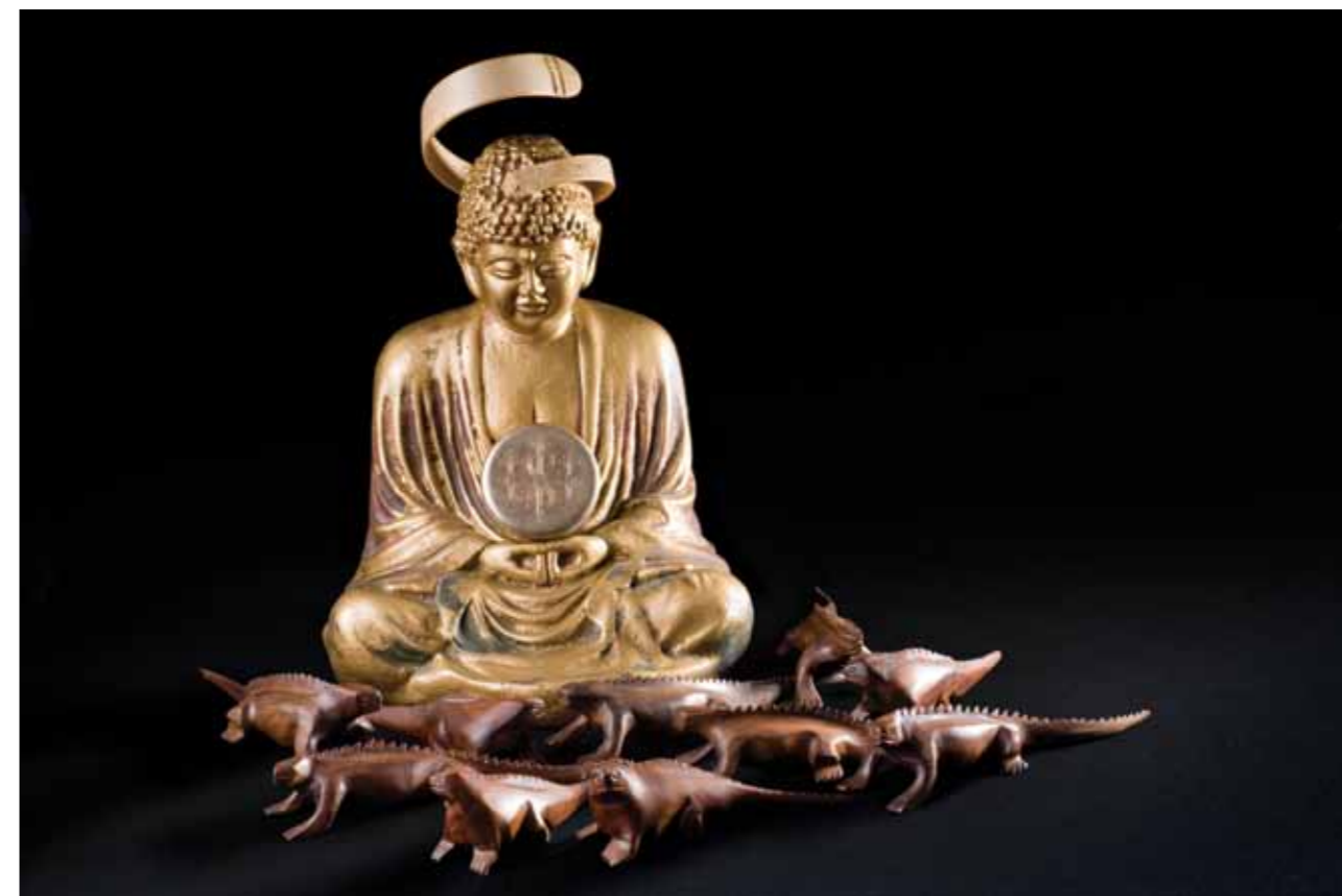
Altar 2 · Técnica mixta · 40 x 30 x 30 cm · 2009