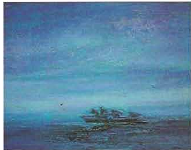
Los hombres y el mar, 1981 Óleo sobre lienzo