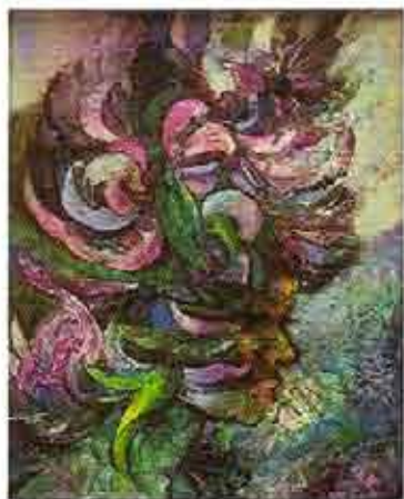
Niña Flor, 1982 Óleo sobre lienzo

Son 130 obras de Jaime Villa que se exponen en la sala A, de exposiciones temporales del Centro Cultural de la Pontificia Universidad Católica del Ecuador. Son 130 obras que responden al manejo de variadas técnicas: óleo, pastel, témpera, acuarela, acrílico, tinta, empleando por igual como soporte, cartulina, madera, tela, entre otros. Es así que, estas 130 obras que bien podrían estar enmarcadas dentro del impresionismo o el realismo abstracto o el figurativo, éstas, transmiten la carga emotiva que el artista plasma en su obra. Con la muestra de Jaime Villa en Quito, queremos cautivar a un público diverso que disfrute del color, las formas, el paisaje, las flores, los rostros, y principalmente que se sienta capturado por las emociones que nos transmite el artista.