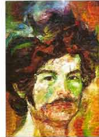
Autoretrato, 1974 Óleo sobre lienzo