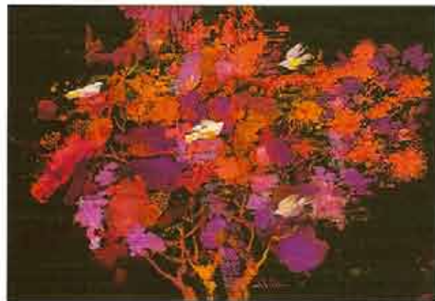
El árbol de mi casa ya no está triste, 2006 Témpera