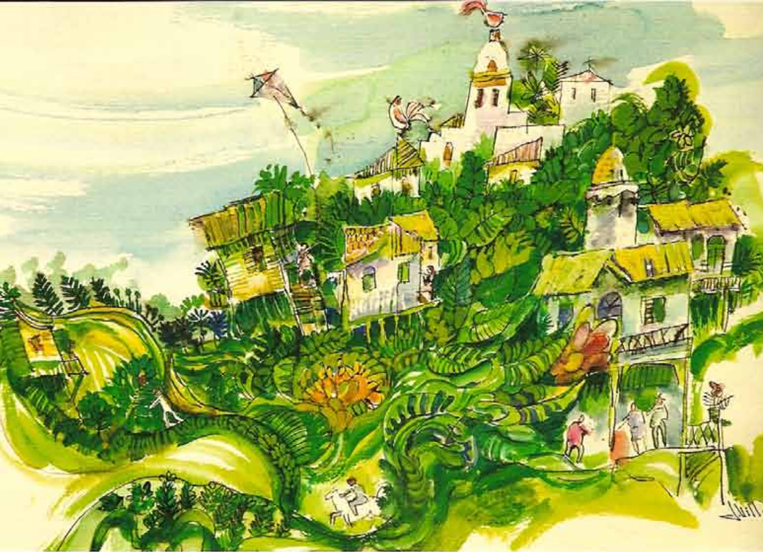
Recinto las maravillas, 2005 Acuarela