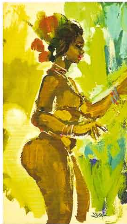
Morena Linda, 1997 Témpera