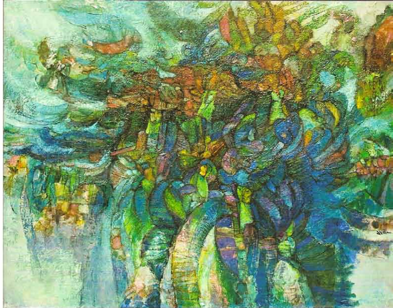
La gran comparsa, 1980 Óleo sobre lienzo