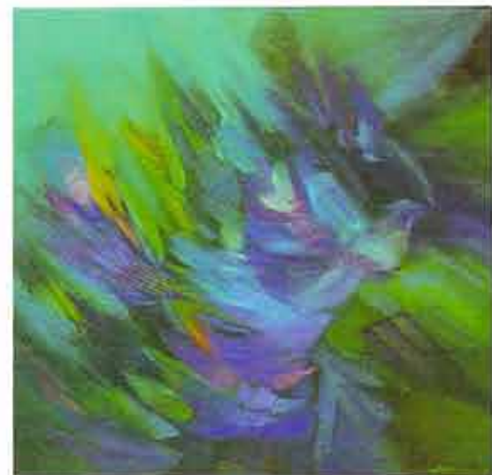
Aves en vuelo, 1998 Óleo sobre lienzo