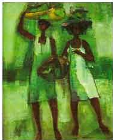
Hermanas Corozo, 1985 Óleo sobre lienzo