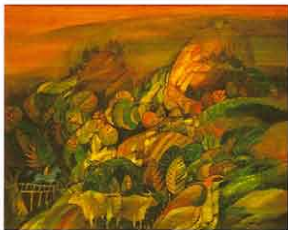
Las vaquitas son ajenas, 1991 Óleo sobre lienzo